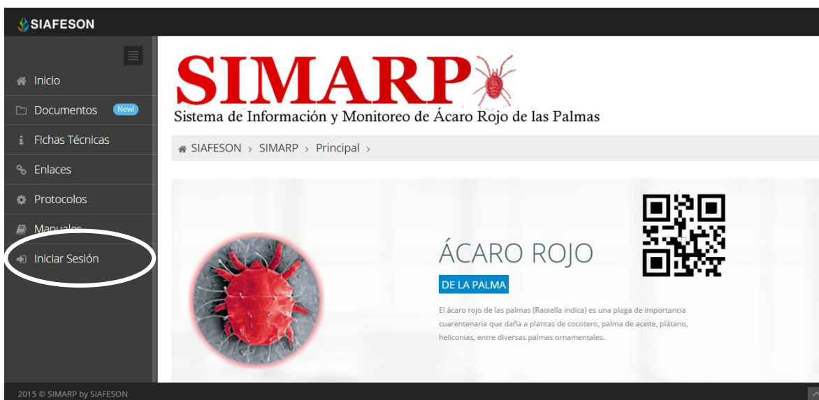
Fig. 2. Ubicación del botón para “Iniciar Sesión” dentro del sistema SIMARP.

Dentro del menú de navegación en la parte izquierda del sitio web SIMARP. Deberá ubicar y dar clic en el botón de “Inicio de Sesión”, este se encuentra ubicado en la parte inferior izquierda del menú en la página principal. La ubicación del botón se muestra en la figura 2.