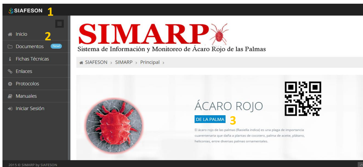
Fig. 1. Primera pantalla dentro del sistema SIMARP.

Para acceder a la página principal deberemos indicarle a nuestro navegador la dirección http://www.siafeson.com/simarp.php