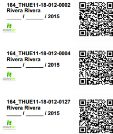
Fig. 45. Pantalla que muestra etiquetas generadas.

El sistema genera un archivo PDF con las etiquetas correspondientes, mostrando con el código QR generado el nombre del campo, así como el nombre del técnico y la fecha correspondiente. Tal como se muestra a continuación en la siguiente figura 45.