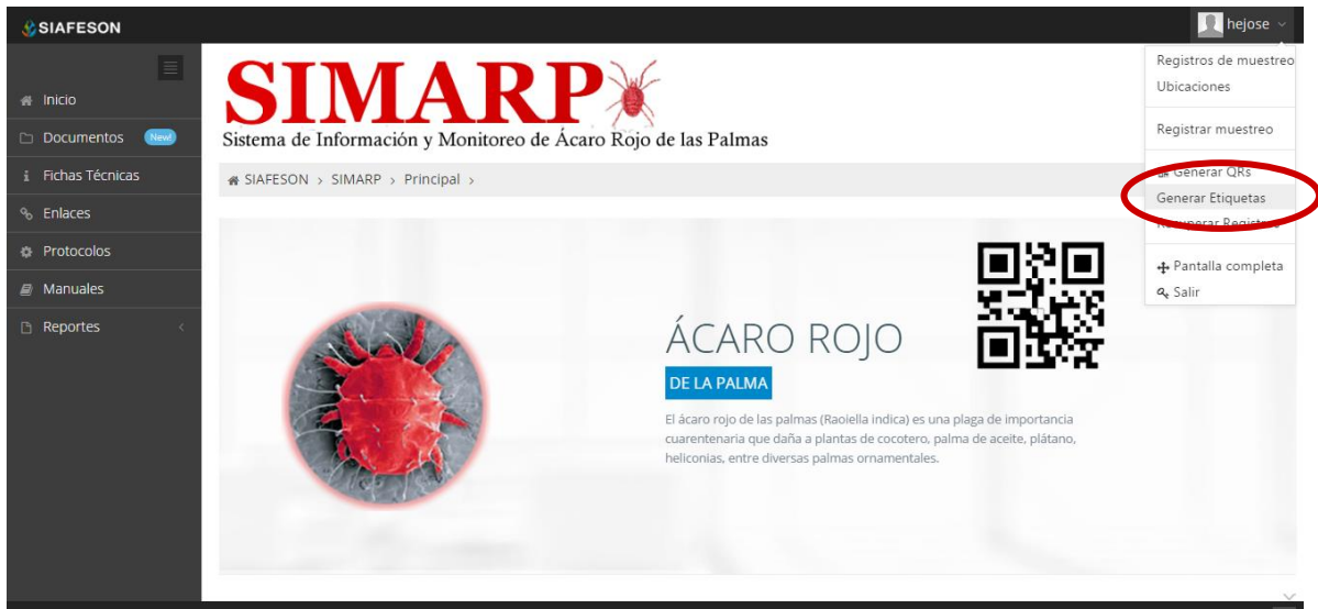
Fig. 42. Ubicación dentro del menú desplegable para ingresar a “Generar Etiquetas”.

Dentro del menú principal del sitio se muestra la opción para crear las etiquetas asignadas de cada técnico dentro de los predios determinados, para ingresar a “Generar Etiquetas” es necesario encontrarse en el apartado donde se despliega el menú principal del sitio y seleccionar la opción correspondiente, la ubicación de esta sección se muestra en la siguiente figura 42.