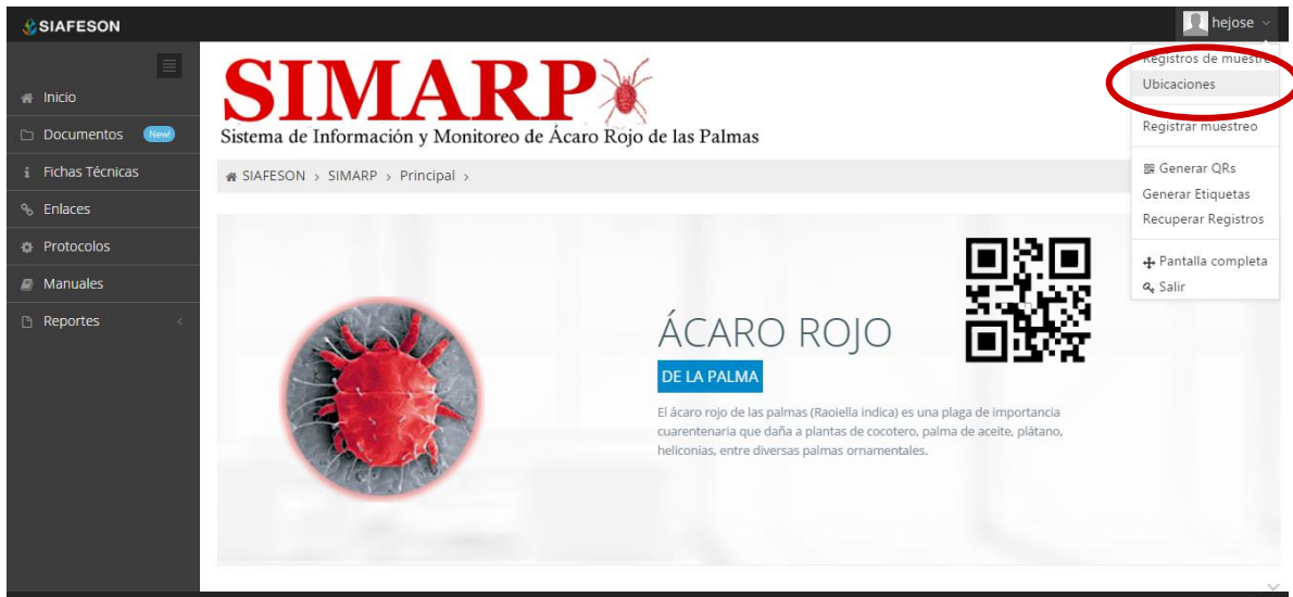
Fig. 25. Ubicación del enlace para ingresar a verificación de Ubicaciones.

La opción se encuentra dentro del menú principal donde se maneja el sistema, para realizar esta acción es necesario seleccionar la opción de “Ubicaciones” que se encuentra ubicada dentro del menú principal del sistema el cual se encuentra en la parte superior derecha como segunda opción, tal como se muestra en la figura 25.