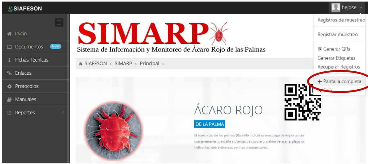
Fig. 48. Sección en el menú desplegable para ingresar a “Pantalla Completa”.

Para ingresar al apartado de pantalla completa del sitio web SIMARP es necesario seleccionar del menú superior derecho la opción de “Pantalla Completa” como se muestra en la figura 48.