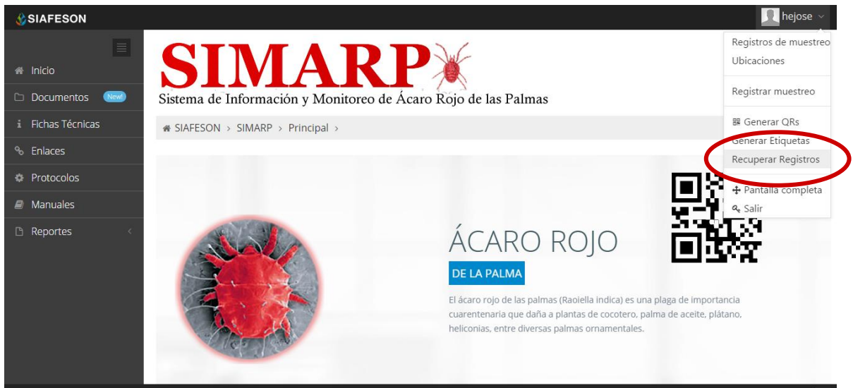
Fig. 46. Sección en el menú desplegable para ingresar a “Recuperar Registros”.

El sitio SIMARP ofrece la opción para recuperar registros del móvil que no se ven reflejados dentro del sistema. Para esta acción es necesario estar en el apartado “Recuperar Registros” que se encuentra ubicado dentro del menú principal de SIMARP. Tal como se muestra en la figura 46.