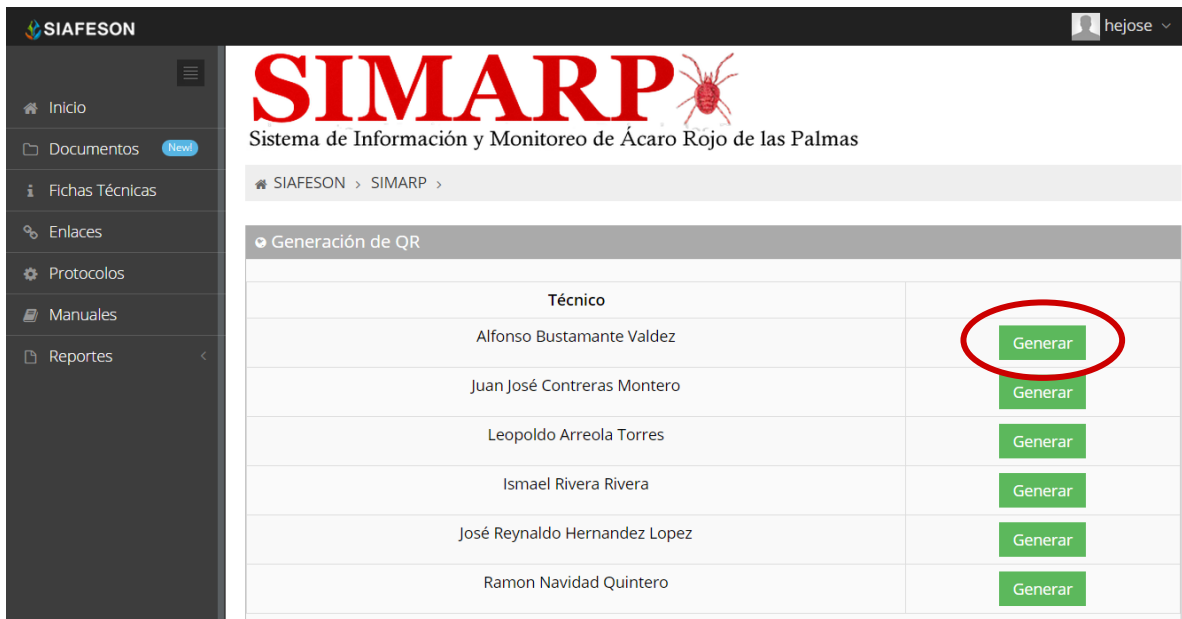
Fig. 39. Listado de técnicos registrados para generar “Código QR” y ubicación del botón “Generar”.

Posteriormente se muestra en pantalla los códigos QR generados. La Figura 39 muestra los QR's generados, como se muestra el nombre del campo se imprime en la parte superior del QR. En la parte superior central de la pantalla se encuentra el botón para imprimir los QR generados y enseguida del mismo se encuentra el botón el cual proporciona la opción de regresar a la página anterior. La ubicación de estos botones se muestra en la figura 40.