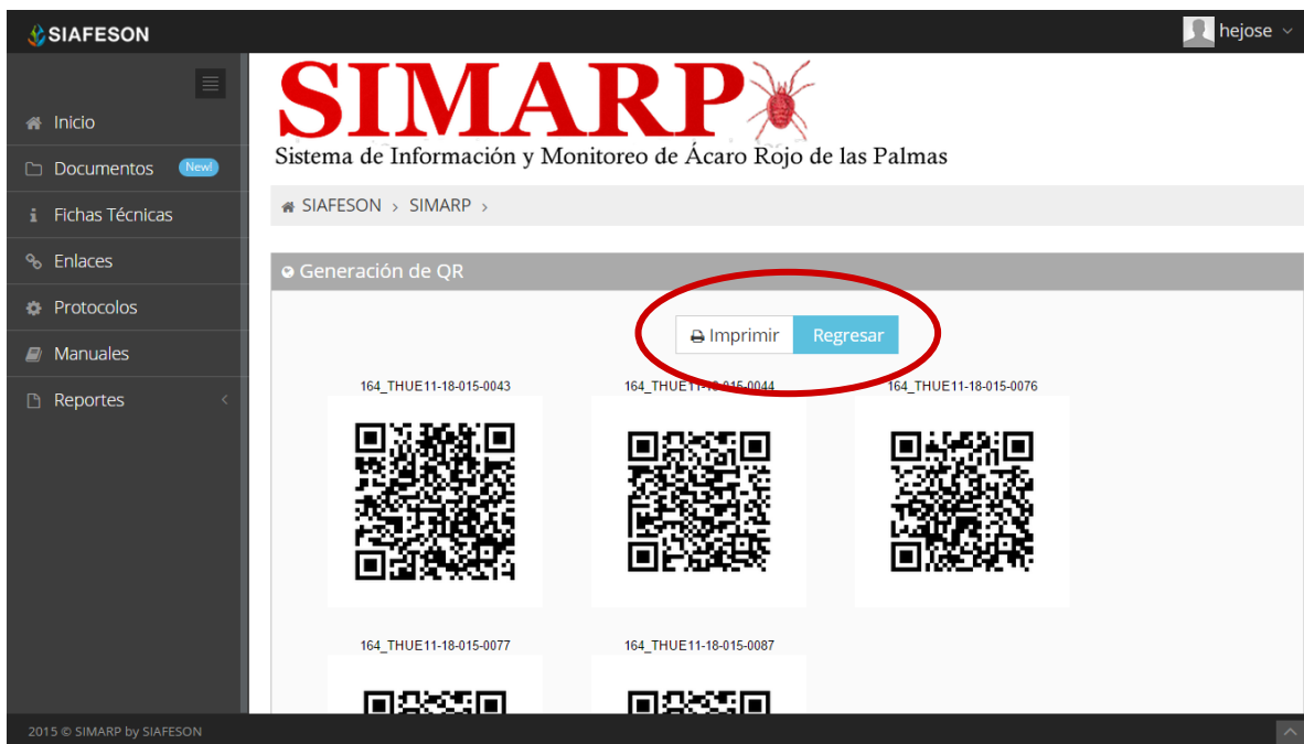
Fig. 40. QR impreso y ubicaciones de los botones “Imprimir” y “Regresar”.

Posteriormente se muestra en pantalla los códigos QR generados. La Figura 39 muestra los QR's generados, como se muestra el nombre del campo se imprime en la parte superior del QR. En la parte superior central de la pantalla se encuentra el botón para imprimir los QR generados y enseguida del mismo se encuentra el botón el cual proporciona la opción de regresar a la página anterior. La ubicación de estos botones se muestra en la figura 40.