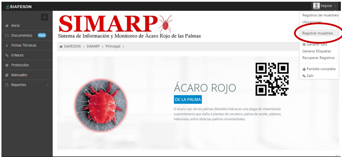
Fig. 27. Sección en el Menú desplegable para ingresar a “Registrar Muestreo”.

Dentro del menú del sitio se encuentra la opción para registrar la información muestreada vía web. Para realizar esta acción es necesario seleccionar la opción de “Registrar Muestreo” que se encuentra ubicada dentro del menú principal del sistema el cual se encuentra en la parte superior derecha como segunda opción, tal como se muestra en la figura 27.