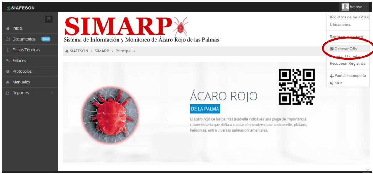
Fig. 38. Sección en el menú desplegable para ingresar a “Generar QR’s”.

El sistema cuenta a su vez con la opción para generar e imprimir los códigos QR de los campos asignados para el técnico correspondiente, para así facilitar el muestreo en campo. Para poder generar un QR es necesario seleccionar el apartado “Generar Qr’s” ubicado dentro del menú principal del sitio tal como se muestra en la figura 38.