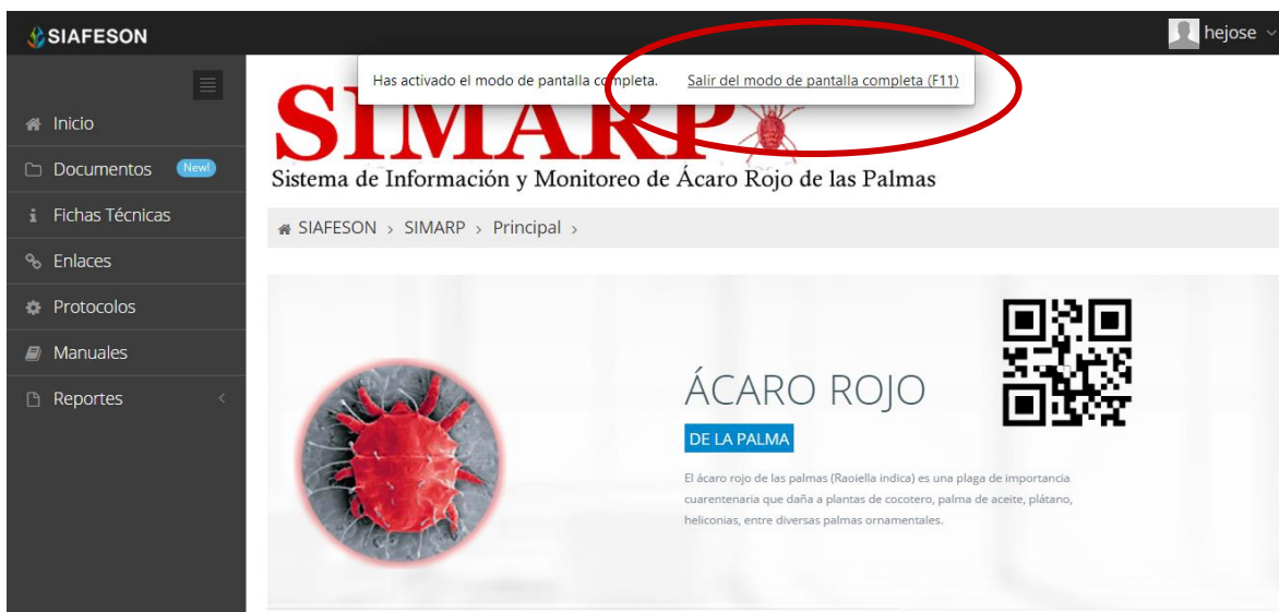
Fig. 49. Pantalla Completa del sistema SIMARP.

Al seleccionar la opción de pantalla completa el navegador del sistema se mostrará como pantalla completa en su ordenador. Una vez mostrándose en pantalla completa le informa en la parte superior de la pantalla la notificación que se encuentra en “Pantalla Completa”, la figura 49 muestra sistema SIMARP en pantalla completa.