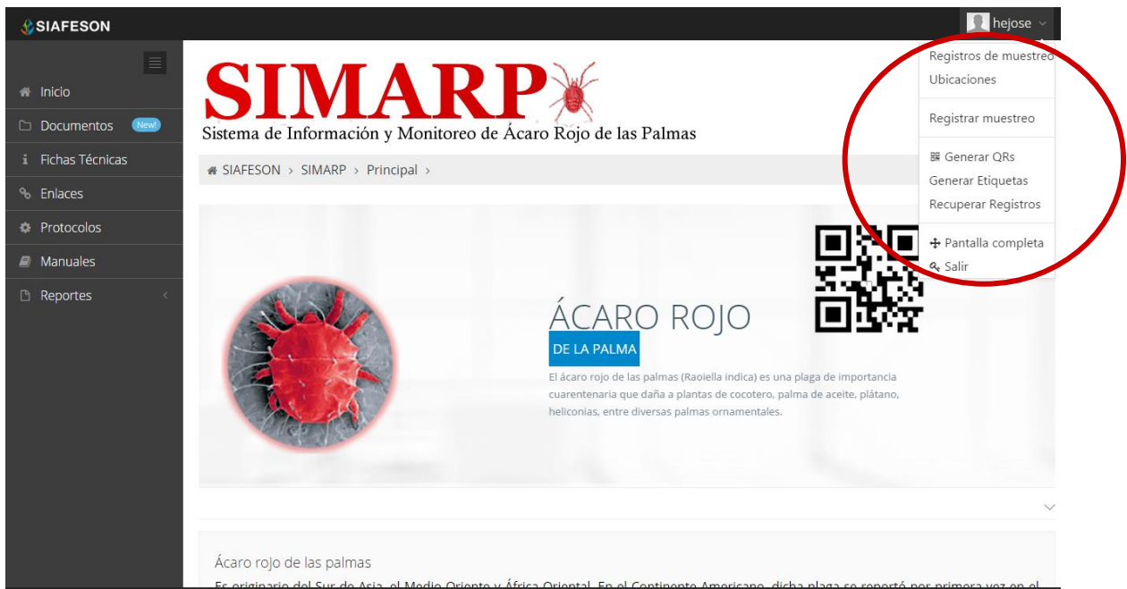
Fig. 5. El sistema reconoce el usuario y muestra las opciones permitidas dentro del nivel ingresado.

En las siguientes secciones se explicará a detalle los pasos a seguir en cada una de las opciones disponibles dentro del sitio, las cuales se visualizan en pantalla tal como lo muestra la figura 5.