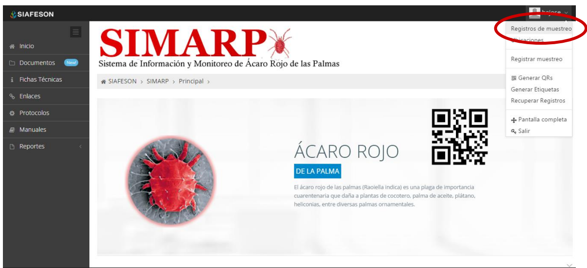
Fig. 6. Ubicación del botón para ingresar a “Registros de Muestreo” dentro del menú principal.

Para ingresar al área de “Registros de Muestreo” es necesario seleccionar la primera opción del menú desplegable que muestra el sistema, el cual se encuentra ubicado en la parte superior de la página tal y como se muestra a continuación en la figura 6.