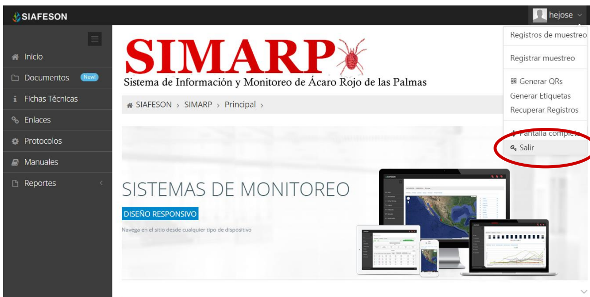
Fig. 50. Ubicación del botón para “Salir” del sistema SIMARP.

Es necesario dar clic en el botón “Salir” que se encuentra ubicado en la parte superior derecha del sitio tal como lo muestra la figura 50.