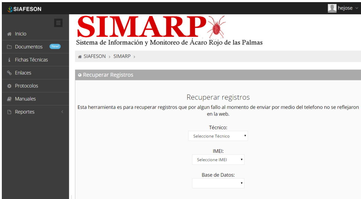
Fig. 47. Ubicación de las opciones disponibles desplegables: Técnicos, IMEI y la base de datos para recuperación de registros.

A continuación se muestran los pasos que son necesarios antes de hacer el envío.